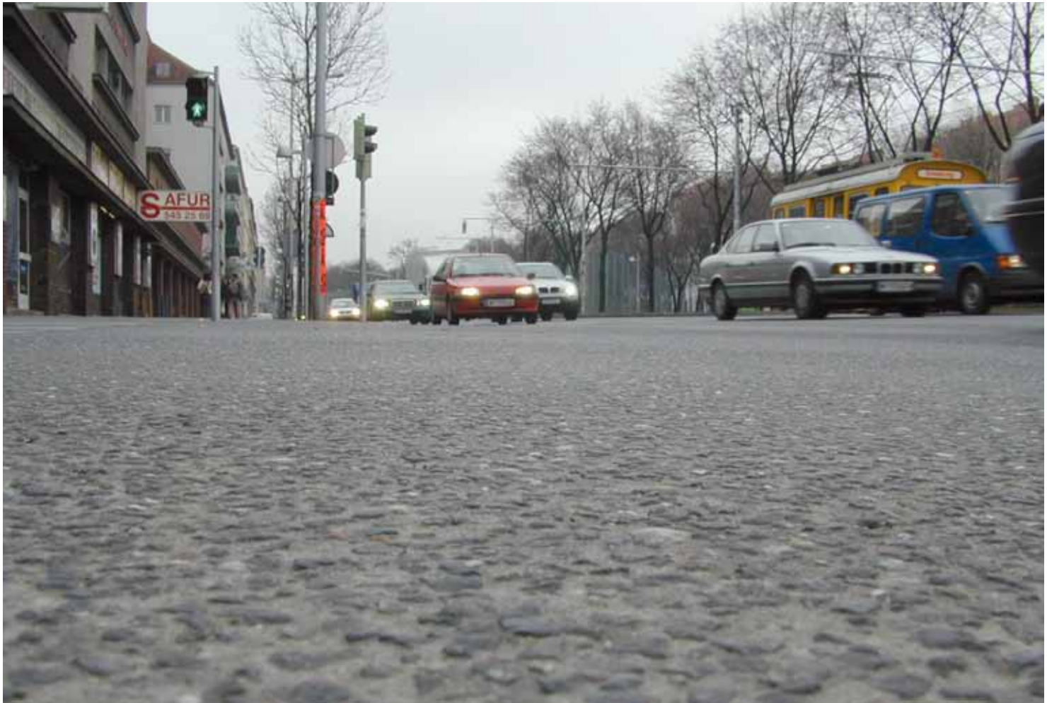
Abbildung 3: Waschbetonoberfläche – Margareten Gürtel, Wien, 2007

geeignet. Sie stellen für das hochrangige Strassen-netz (Autobahnen und Schnellstrassen) mit dem stark zunehmenden Schwerlastanteil und dem sich ständig erhöhenden Verkehrsaufkommen, insbesondere aus Gründen der Verkehrssicherheit, des Umweltschutzes und der Wirtschaftlichkeit, eine optimale Lösung dar.