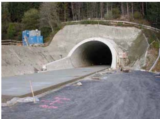
Abbildung 4: Betonfahrbahndecke im Herzogbergtunnel, Südautobahn A2

Sie stellt heute die Standardbauweise in Österreich dar und hat sich auch im städtischen Bereich bewährt. Jüngste Untersuchungen (Forschungsauftrag des BMVIT) [1] bestätigen das gute Langzeitverhalten: die Waschbetonoberfläche mit Grösstkorn 8 mm