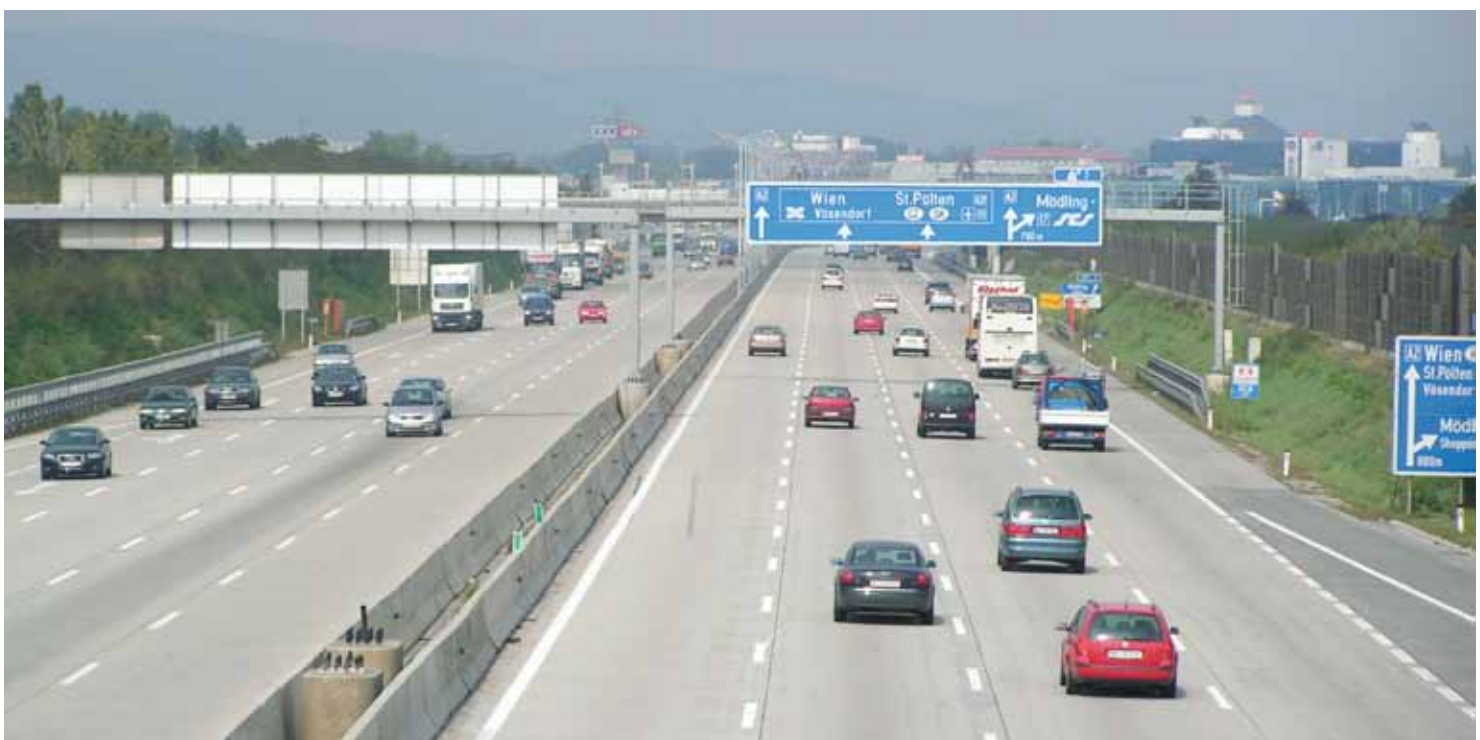
Abbildung 1: Generalerneuerung und Verbreiterung Knoten Vösendorf – Südatabahn A2, 2005

Bereits 1990 wurde in Österreich die Waschbetonbauweise mit ihren guten lärmindernden Eigenschaften und ihrem hohen Griffigkeitsniveau eingeführt. Sie stellt heute die Standardbauweise für das hochrangige Strassennetz in Österreich dar und hat sich auch im städtischen Bereich bewährt. Jüngste Untersuchungen (Forschungsauftrag des Bundesministeriums für Verkehr, Innovation und Technologie BMVIT) [1] bestätigen das gute Langzeitverhalten: die