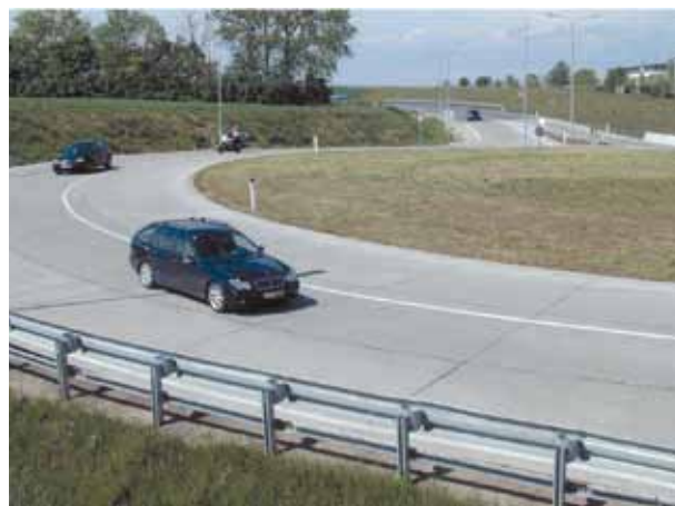
Abbildung 5: Kreisverkehr Schwechat, Niederösterreich