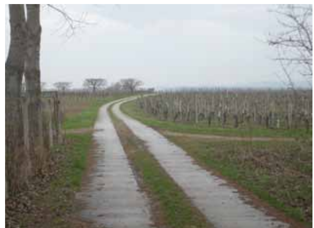
Abbildung 8: Spurweg Horitschon, Bgld.

Mit einer innovativen Technik können diese Spurrinnen dauerhaft instand gesetzt werden: Die alte Asphaltunterlage wird etwa 10 cm tief abgefräst und die verbleibende Oberfläche sorgfältig gereinigt. Anschliessend wird hochwertiger Strassenbeton entsprechend der Frästiefe aufgebracht, sodass ein guter Verbund entsteht. Diese Technik nützt die Tragfähigkeit der verbleibenden Asphalt-schicht und stellt die Verformungsresistenz durch die dünne Betondecke sicher [14].