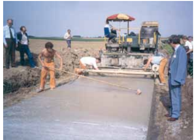
Abbildung 7: Einbau mit Fertiger

Bei stark belasteten Asphaltstrassen entstehen in Hitzeperioden in Staubereichen (z.B. vor Kreuzungen, Bushaldebuchten etc.) häufig Spurrinnen. Instandsetzungen erfordern meist den Austausch dicker Schichten, manchmal treten wieder Verformungen auf.