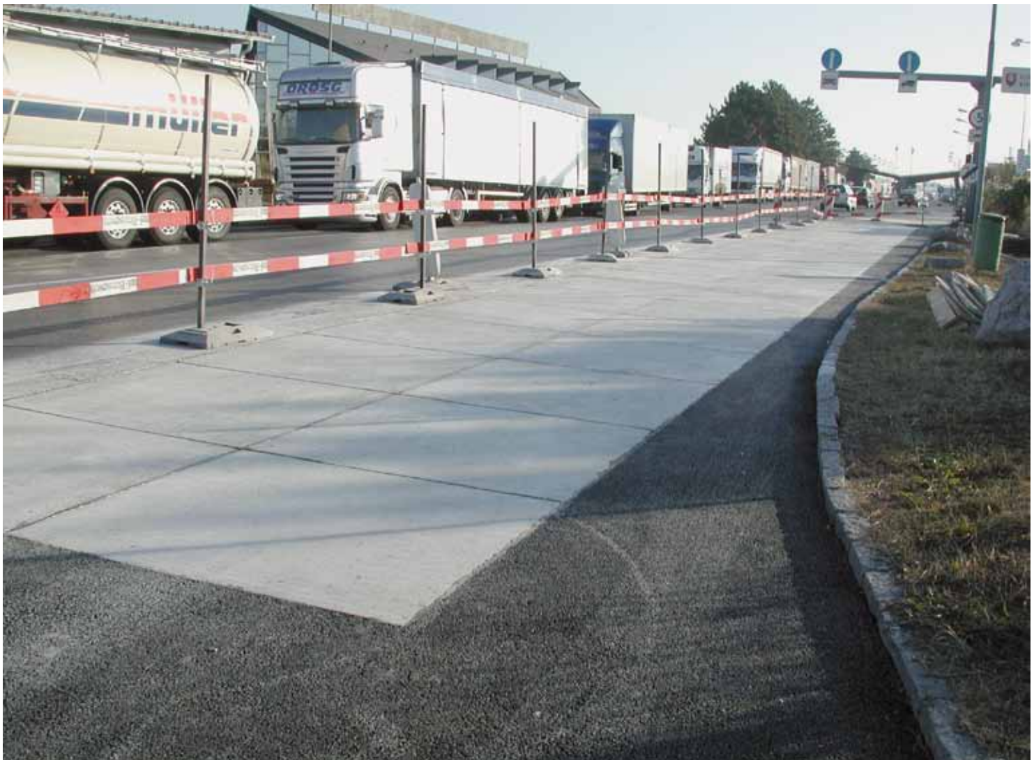
Abbildung 6: White Topping Referenzstrecke Berg, NÖ

Tunnel werden unter grösstmöglichen Sicherheitsaspekten geplant und gebaut. Als Folge der schweren Brandereignisse in Tunneln in den vergangenen Jahren wurde in Österreich in der RVS 09.01.23 [9] festgelegt, dass ab einer Tunnellänge von 1000 m eine Betonfahrbahndecke anzuordnen ist (Abbildung 4).