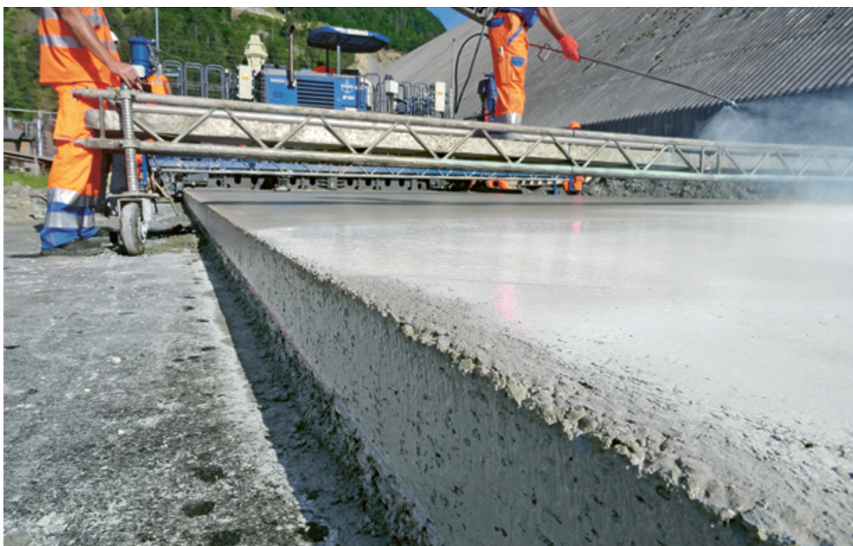
Aufsprühen von Abbindeverzögerer und Curingmittel auf die Oberfläche

ligen Konsistenzklassen entwickelt. Der Beton musste zudem hohe Anforderungen bezüglich Luftporengehalt, Abriebfestigkeit sowie seiner Beständigkeit gegen die Alkali-Aggregat-Reaktion erfüllen. Zur Anwendung gelangte daher ein von der Holcim eigens für Infrastrukturbauten entwickelter Zement, der Robusto 4R-S. Die Gesteinskörnung musste insbesondere die dauerhafte Griffigkeit des Belags gewährleisten und daher einen genügenden Polierwert (PSV) aufweisen. Verlangt war ein PSV von mehr als 50, was für die Erschliessungsstrasse als sicher ausreichend gelten darf.