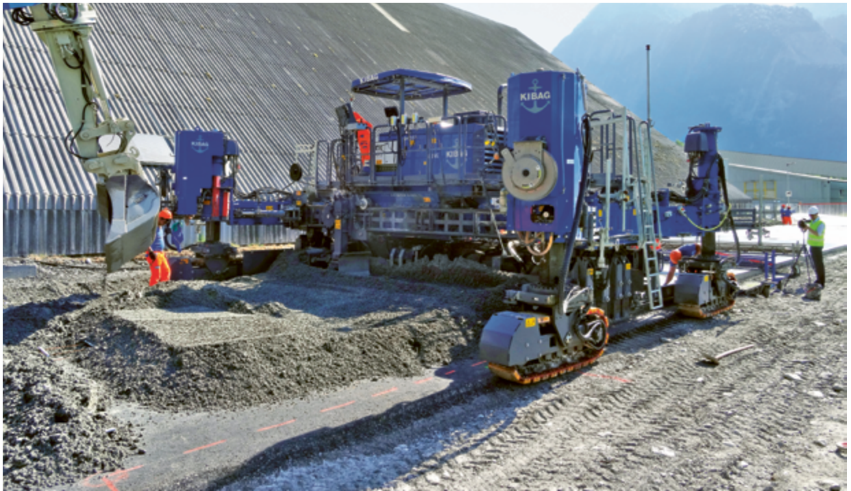
Maschineller Einbau mit dem Gleitschalungsfertiger