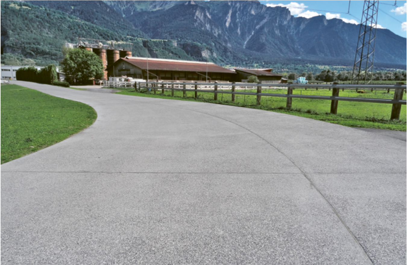
Blick auf die fertige Erschliessungsstrasse mit den nachträglich gefrästen und verfüllten Fugen des Belags