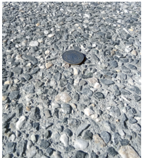
Die Waschbetonoberfläche sorgt für eine gute Griffbarkeit und eine hohe Lärminderung.

Zement: Robusto 4R-S (CEM II/B-M (S-T) 42,5 R HS-CH)