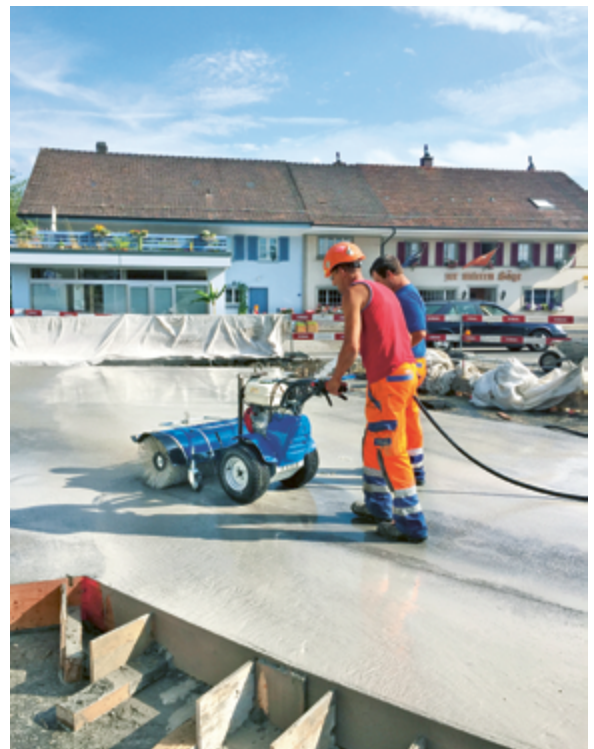
Maschinelles Ausbürsten der Zementhaut zum Erstellen der Waschbetonoberfläche

Der Fahrbahnbelag besteht aus einer einzigen, 23 cm dicken Schicht aus Splittbeton mit einem Grösstkorn von 11 mm, als Asphaltunterlage diente eine 7 cm dicke Heissmischfundationsschicht AC F 22. Der auf rund 370 Metern Länge mögliche maschinelle Einbau bedingte einen steifplastischen Beton (Konsistenz C1), während der in den gut 100 Meter langen Kurvenbereichen von Hand erfolgende Einbau eine weichplastische Konsistenz C2 erforderte. Daher wurden spezielle Rezepturen für die jewei-